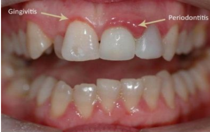
Alle Arten von Zahn- und Zahnfleischinfektionen