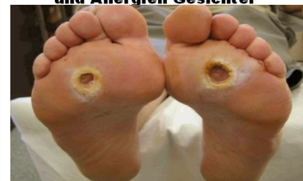
Diabetische Wunden und Geschwüre