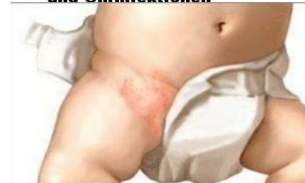
Alle Arten von Verletzungen und Hautausschlag