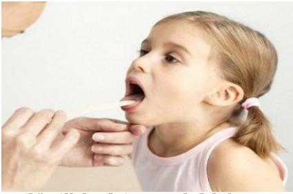
Sämtliche Arten von Infektionen im Rachen und der Mundhöhle