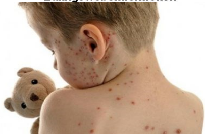
Alle Arten von Hautausschlägen und Hautallergien