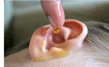
Alle Arten von Infektionen und Ohrinfektionen