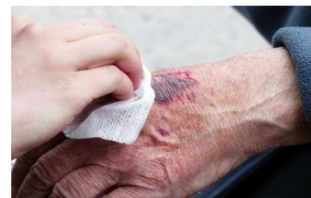
Psoriasis und Hauttumoren