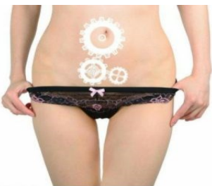
Infektionen und Erkrankungen der Genitalien