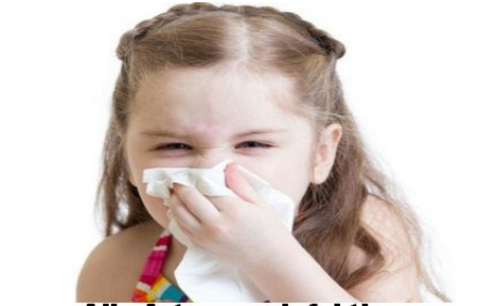
Alle Arten von Infektionen der Atemwege